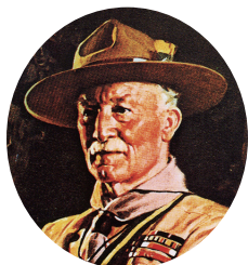
ボーイスカウトをつくった人 ベーデン・パウエル卿

令和5年10月10日 第10号 発行 ボーイスカウト 高崎地区協議会 編集 会員拡充委員会